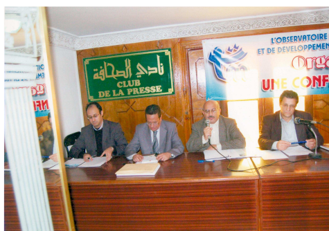
1 ère conférence de presse (Club de la presse)

A l'occasion de la publication du premier numéro de « Transparency News », l'Observatoire a organisé au mois de novembre 2007, au Club de la Presse à Rabat, une conférence de presse consacrée largement à la présentation officielle de l'Observatoire et de sa « cellule de soutien et de conseil juridique aux victimes de la corruption ». De nombreux journalistes et personnes intéressées ont pris part à la rencontre