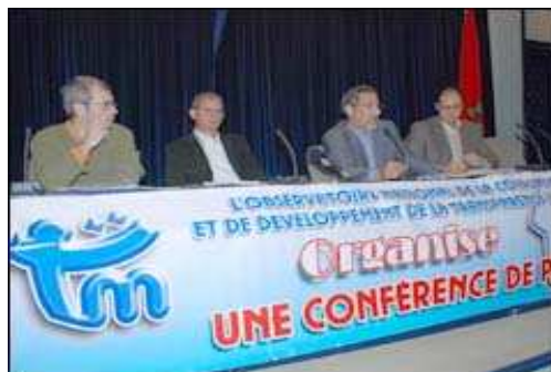
2 ème conférence de presse (MAP)

Les deux conférences ont connu une bonne couverture médiatique avec la publication de plusieurs articles de presse et des commentaires à la Radio et à la TV.