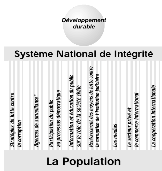
Diagramme 2: Les piliers de l'intégrité

* Agences de lutte contre la corruption, Médiateur, Contrôleur Général des Comptes